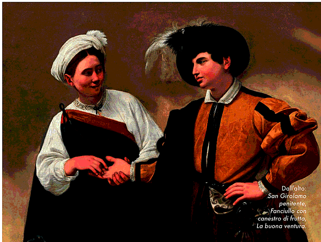
Dall'alto: San Girolamo penitente, Fanciullo con canestro di frutta, La buona ventura.